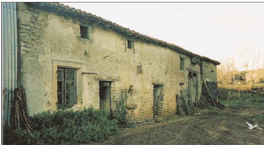
La borderie de La Coussaye vers 1990 (Photo Y. Brunet).