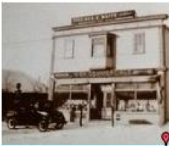
Façade de l'Union commerciale Bazin